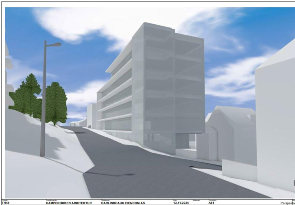
Figur 1: Illustrasjon av mulig bygningskropp etter endring. Kilde: Hamperokken Arkitektur