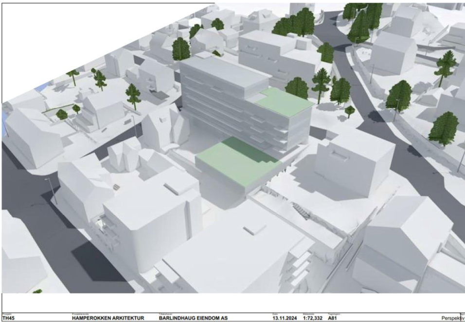
Figur 3: Illustrasjonen viser uteoppholdsarealer med grønt.

FEIL! DET ER INGEN TEKST MED DEN ANGITTE STILEN I DOKUMENTET. FEIL! FANT IKKE REFERANSEKILDEN.