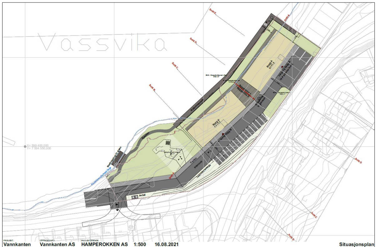
Figur 3: Illustrasjonsplan Vassvika.