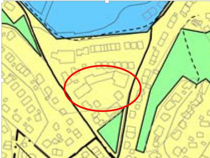
Figur 1: Utsnitt kommuneplanens arealdel 2017-2028.

Eiendommene er avsatt til bolig i kommuneplanens arealdel.